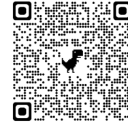
大会参加申込 URL QRコード

チャリティーセミナー申込のURL： https://forms.gle/QvoEpyH3J4CxMKs17